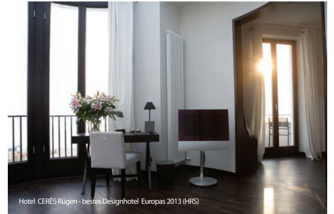
Hotel CERÉS Rügen - bestes Designhotel Europas 2013 (HRS)