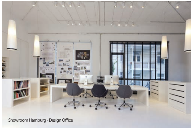
Showroom Hamburg - Design Office