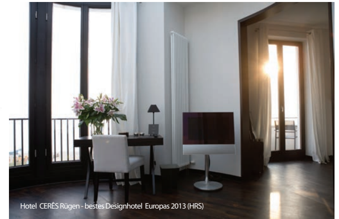
Hotel CERÉS Rügen - bestes Designhotel Europas 2013 (HRS)