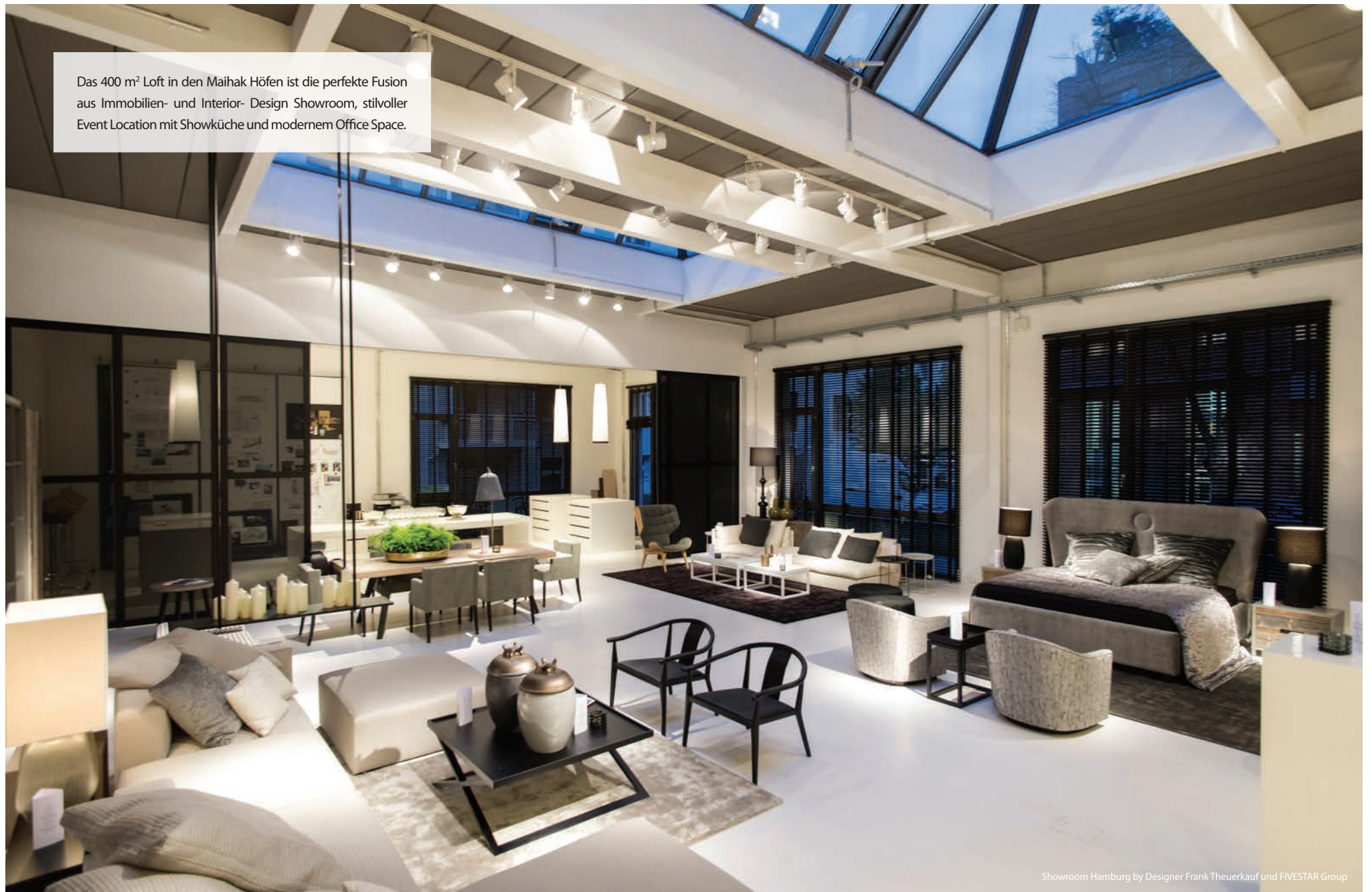
Showroom Hamburg by Designer Frank Theuerkauf und FIVESTAR Group

Das 400 m 2 Loft in den Maihak Höfen ist die perfekte Fusion aus Immobilien- und Interior- Design Showroom, stilvoller Event Location mit Showküche und modernem Office Space.